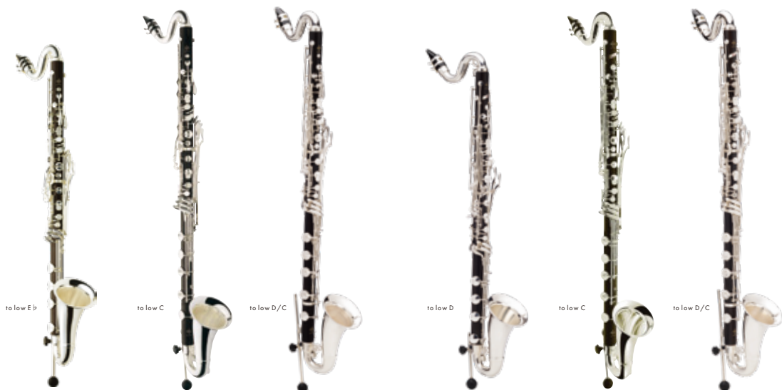
BC1183 ¥ 1,916,000 (税込 ¥ 2,107,600)